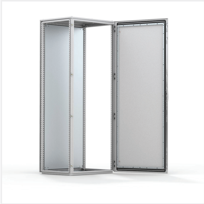
IP 55 | TYPE 12 | IK 10