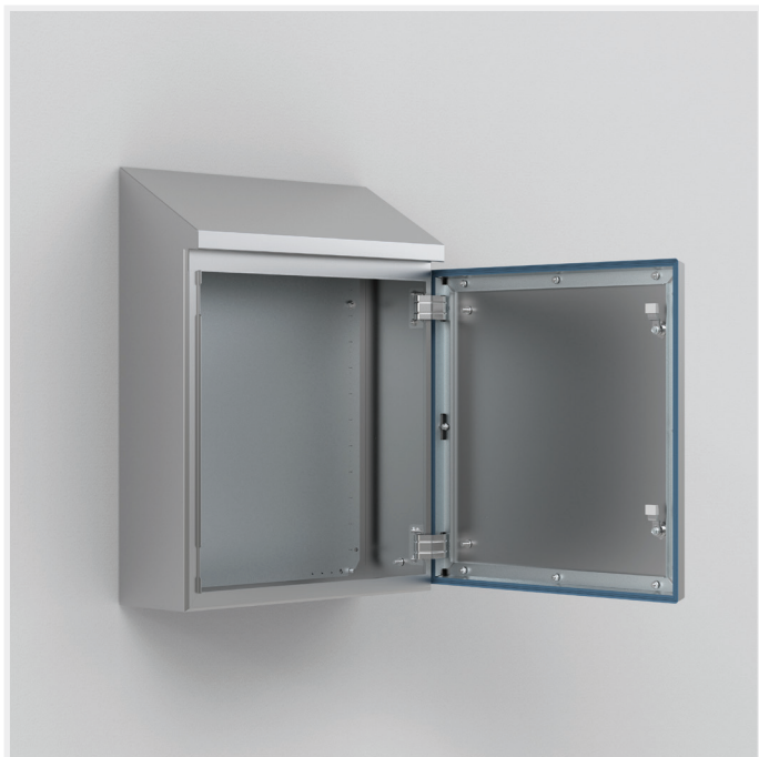
IP 66/69 | TYPE 4X, 12, 13 | IK08