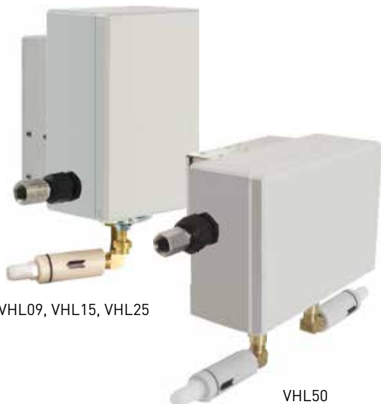
VHL09, VHL15, VHL25